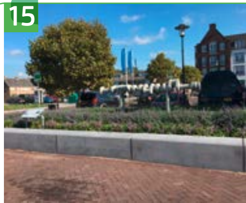
MONUMENT KRUKAS DE MARKT

Dit monument is feestelijk onthuld in 2017. Het is opgericht ter herinnering aan de machinebouw en industrie in Krimpen a/d Lek. De uitvoerend kunstenaar is Leo Jongenotter. Het monument bestaat uit de 'krukas' van een scheepsdieselmotor. Deze krukas is in 1964 vervaardigd bij de Bolnes motorenfabriek en heeft 36 jaar gefunctioneerd in een dieselmotor. Bolnes is opgericht in 1885 in Bolnes en het is in 1910 verplaatst naar de Zaag in Krimpen a/d Lek. Tot 1988 bouwde het bedrijf dieselmotoren en verleende het wereldwijd service. Het bedrijf is jarenlang een belangrijke werkgever geweest voor inwoners van Krimpen a/d Lek.