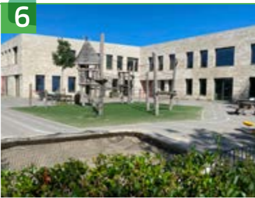
MFA ADMIRAAL DE RUYTERSTRAAT 1