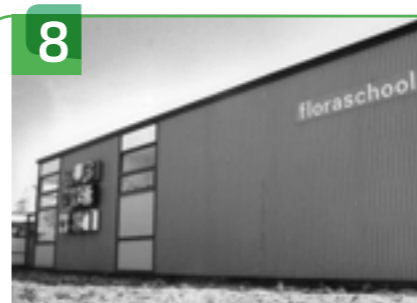
KUNSTWERK VOORMALIGE OBS FLORASCHOOL KRUISING FLORA-/SPEENKRUIDSTRAAT