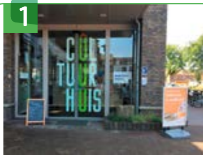
CULTUURHUIS DE MARKT 201