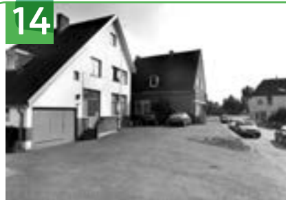
RIETVELDHUIS RIJSDIJK 22

Op Rijsdijk 22 staat het Rietveldhuis dat is gebouwd in 1938 en ontworpen door architect Gerrit Rietveld. Uniek aan dit ontwerp is het Noorse dak. Rietveld was een bekende Utrechtse kunstenaar en meubelontwerper en hij is onder meer bekend van de Rietveldstoel. Gerrit Rietveld was lid van de kunststroming De Stijl. Hij was een pionier van het nieuwe bouwen.