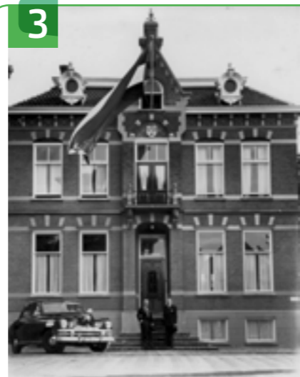
VOORMALIG RAADHUIS EN POLITIEBUREAU DORPSSTRAAT 7

De huidige Nederlands Hervormde kerk kwam in 1940 tot stand naar ontwerp van architecten M.C.A. Meischke en W. Vermeer en ze verving de oude dorpskerk. Het interieur is afkomstig uit de oude kerk, waaronder de preekstoel (1615) en het doophek (ca. 1730). In 2003 is de kerk aan de oostzijde uitgebreid met 't Voorhof. De walvis als windwijzer op de kerktoren herinnert aan de walvisvaart van 1714 tot 1786. Rederij Van Holst en veel commandeurs kwamen uit Krimpen a/d Lek.