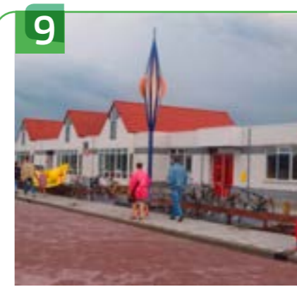
OBS FLORASCHOOL BAKEN 19