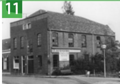
VOORMALIGE DRIJFRIEMENFABRIEK HAAGEN-DRAAIJER ONDER DE WAAL 34