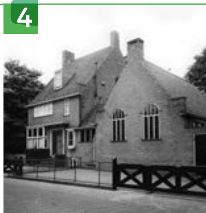
VOORMALIGE PASTORIE DORPSSTRAAT 9