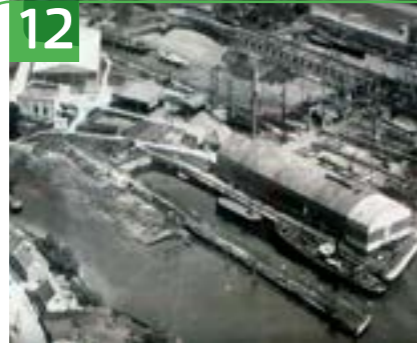
SCHIEPWERF EN DIRECTEURSWONING RIJSDIJK 64

Deze villa aan de Rijsdijk is omstreeks 1865 gebouwd voor de scheepsbouwersfamilie Smit. Van 1853 tot 1947 was op de landtong achter het huis de scheepswerf J&K Smit gevestigd. Van de scheepswerf resteert enkel nog een scheepshelling die te zien is vanaf de dijk, voorbij het huis. Op de scheepswerf zijn vele zeilschepen gemaakt, waaronder de Geertruida Gerarda uit 1904, het grootste ooit in Nederland gebouwde zeilschip. Na de oorlog maakte men een doorstart met de Aluminium Verwerkende Industrie J&K Smit. Op de bouwelling bouwde men onder een Romneyloods mijnnevgers voor de marine.