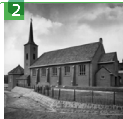
NEDERLANDS HERVORMDE KERK DORPSSTRAAT 1

In het Cultuurhuis zijn een bibliotheek, theaterzaal en het Historische Ontmoetingspunt (HOP) gevestigd. De bibliotheek bezit onder meer historische boeken over Krimpen aan de Lek. In het Cultuurhuis zijn diverse historische voorwerpen te bezichtigen, zoals de scheepsbel, burgemeesterskast en zalmplank.