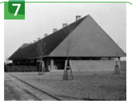
VOORMALIGE OBS PRINSES IRENE SCHOOLSTRAAT 18

Dit gebouw is de Multi Functionele Accommodatie (MFA) uit 2013 naar een ontwerp van Atelier Pro Architecten. Het is een nieuw multifunctioneel gebouw voor OBS Prinses Ireneschool, CBS De Wegwijzer, Buiten Schoolse Opvang (BSO) en gymzaal.