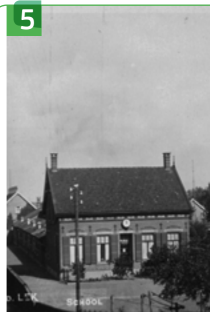
VOORMALIGE SCHOOL MET DE BIJBEL EN SCHOOLMEESTERSHUIS DORPSSTRAAT 152-154

Dit pand is de voormalige pastorie die is gebouwd in 1933 en ontworpen door architect M.C.A. Meischke uit Rotterdam. De plaquette aan de muur heeft mej. De Ridder geschonken. Het pand is deels gesloopt in 1963 en vervangen door een garage. Nu is het een woonhuis. Er waren ook een zondagschool en catechisatielokaal naast het woonhuis.