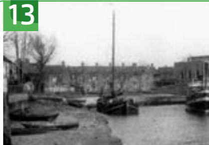
UITKIJKPUNT KARIMATAGAT T.O. RIJSDIJK 35

Op de dijk is een plaquette Karimatagat. Hier waren de helling en haven van de scheepswerf. Op de plek staat een bord dat in 2016 is geplaatst bij het afsluiten van dijkversterkingswerkzaamheden. Het 'gat' is lang gebruikt als loswal voor allerlei goederen. De bijzondere naam voor deze haven is afkomstig van de grote tinbaggermolen 'Karimata' die hier afmeerde van oktober 1938 tot juli 1939.